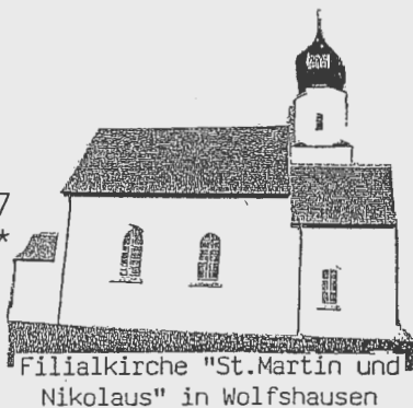
Filialkirche "St. Martin und Nikolaus" in Wolfshausen

Kath. Pfarramt Attenhofen, Pfr.-Schmid-Str. 7 Tel.: 08751 (81 08 18 oder 0170/63 28 55 3 *****