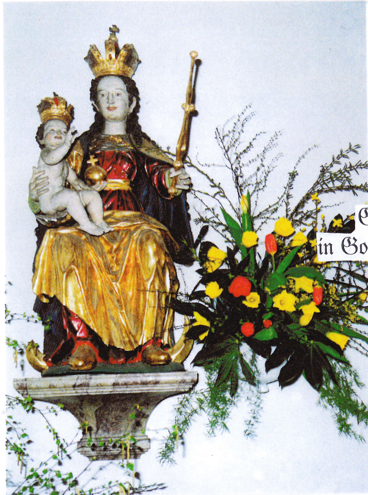
Maria mit Kind Statue um 1630 Pfarrkirche Pötzmes

Nr.8/2024 28.April - 12.Mai 2024 ***** Kath.Pfarramt Attenhofen Tel.:08751/810 818 *****